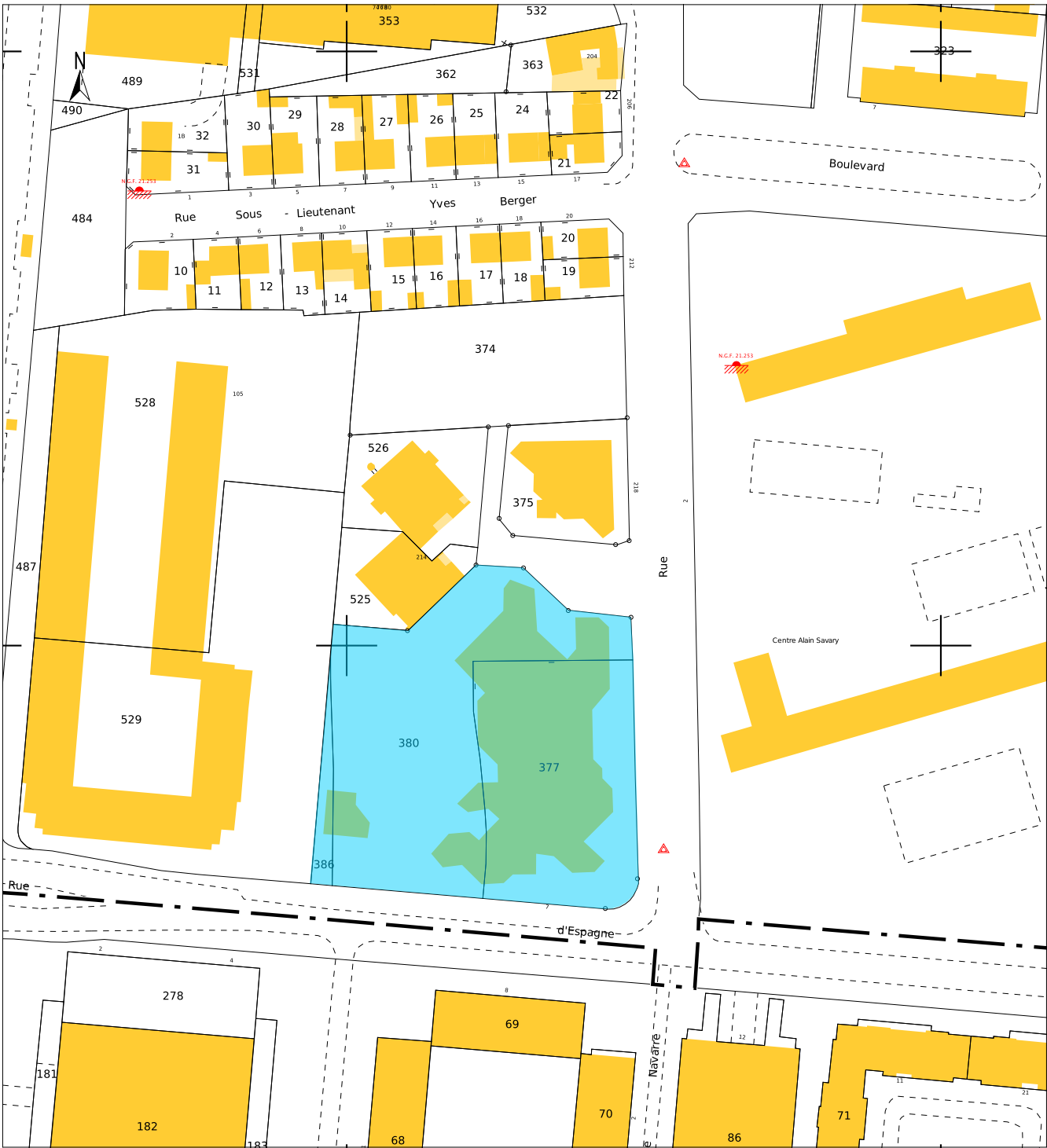
plan cadastral 1/1500